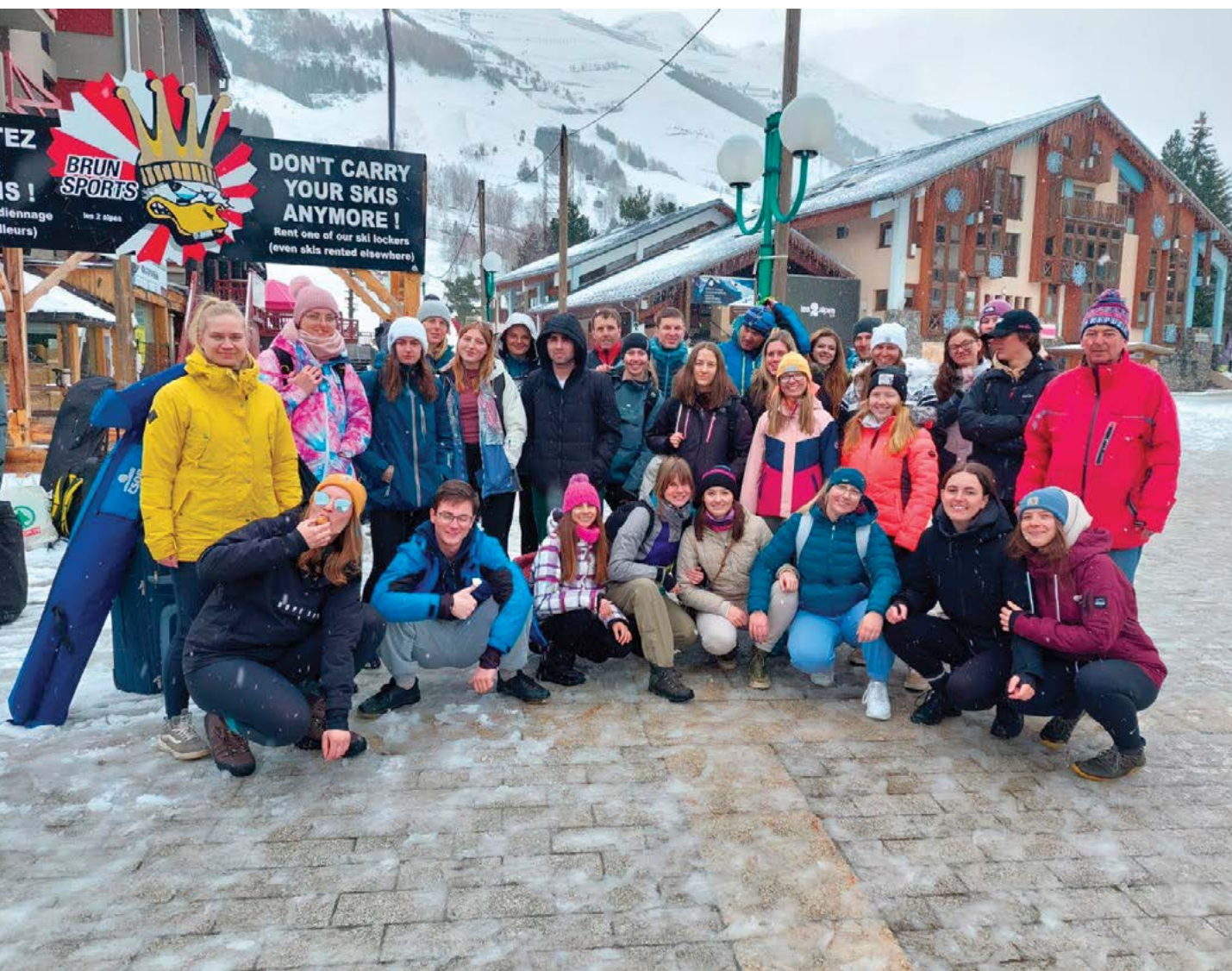
Lyžařský kurs v Alpách