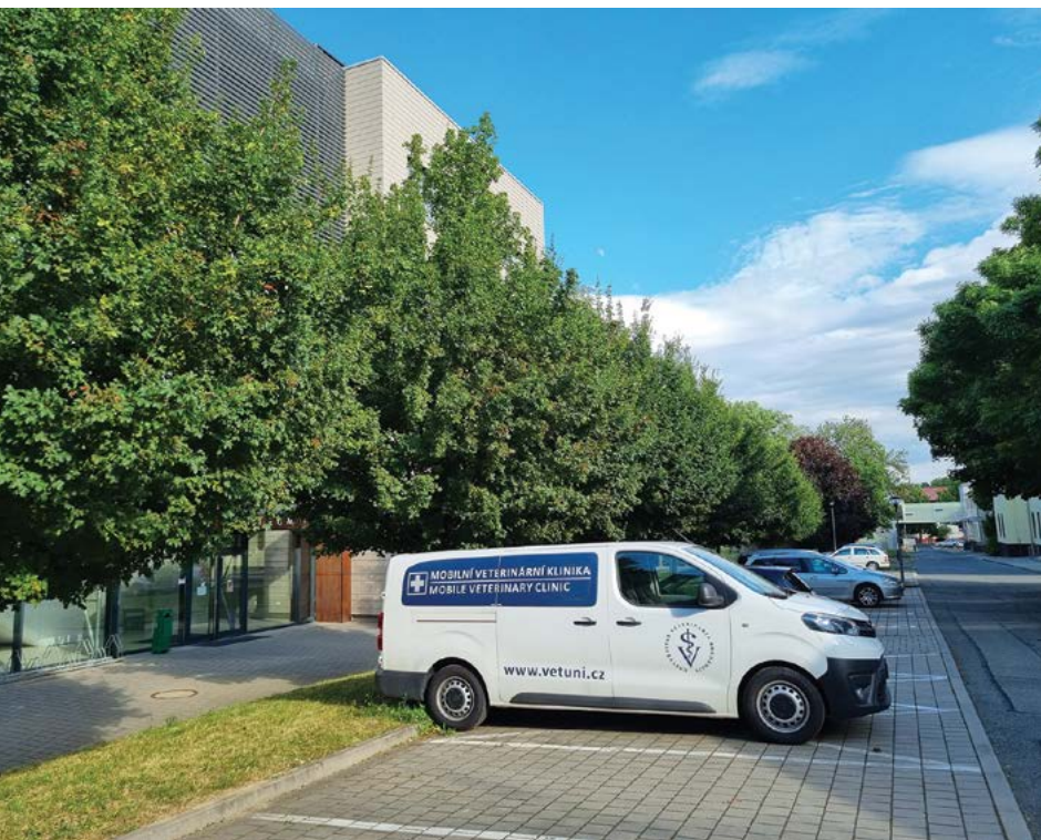
PPSŘ podporuje rozvoj mobilních klinik