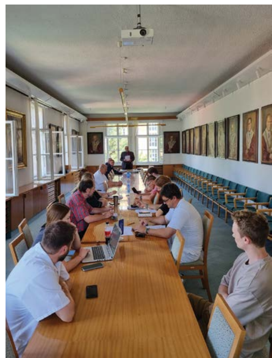
Schvalování Dodatku rozpočtu v Akademickém senátu univerzity