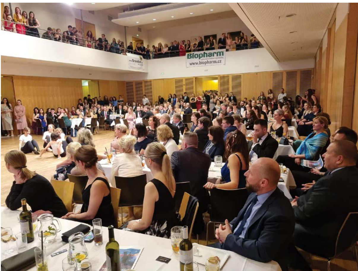
Účast na univerzitním veterinárním plese byla mimořádná a pohybovala se na samé hranici kapacity společenského sálu