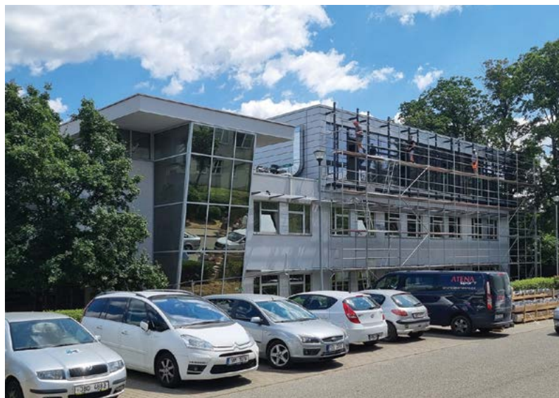
Součástí investic v roce 2023 je vybudování Simulačního centra na Klinice chorob psů a koček

Rozpočet Veterinární univerzity na rok 2023 vychází ze schválených Pravidel pro sestavování rozpočtu na rok 2023 a je založen na multizdrojovém financování univerzity. Neinvestiční rozpočet vychází z předpokládaných výnosů univerzity a z předpokládaných nákladů univerzity a jejích jednotlivých součástí v členění na Fakultu veterinárního lékařství, Fakultu veterinární hygieny a ekologie, Vysokoškolský veterinární výzkumný ústav/CEITEC, ICRC, Institut celoživotního vzdělávání, Rektorát, Společné, Koleje, ŠZP a programové financování. Nejvýznamnější údaje neinvestičního rozpočtu (zahrnující i použití fondů FPP, FÚUP, Fstip, FR, FO) jsou uvedeny v tabulce.