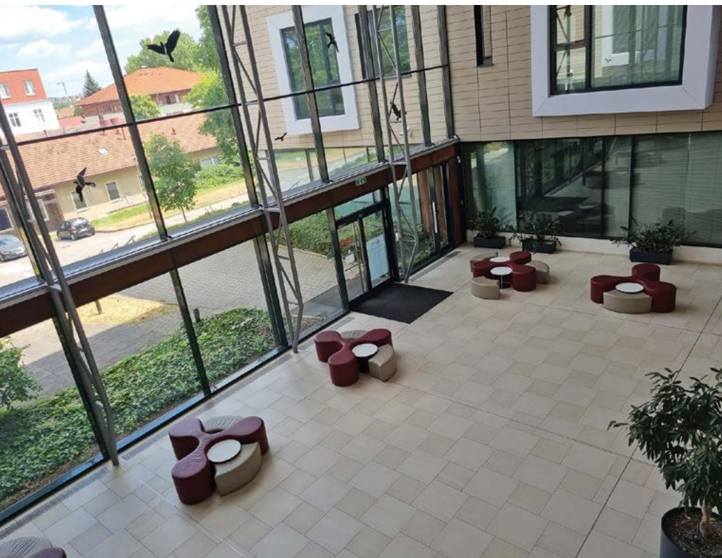
Součástí hodnocení je také prostorové zabezpečení univerzity

ní požadavků kvality v oblasti finančního zabezpečení činností, zejména podíl vlastních prostředků k všem prostředkům na činnost univerzity, a následně podíl vlastních prostředků na vzdělávací činnost k všem prostředkům na vzdělávací činnost univerzity, podíl vlastních prostředků na tvůrčí činnost k všem prostředkům na tvůrčí činnost univerzity, podíl vlastních prostředků na veterinární činnost k všem prostředkům na veterinární činnost univerzity, podíl vlastních prostředků na zemědělskou činnost (ŠZP) k všem prostředkům na zemědělskou činnost univerzity a podíl odchylky v množství prostředků v příslušném roce od množství prostředků v předchozím roce k výši prostředků za předchozí rok vyjadřující finanční stabilitu univerzity.