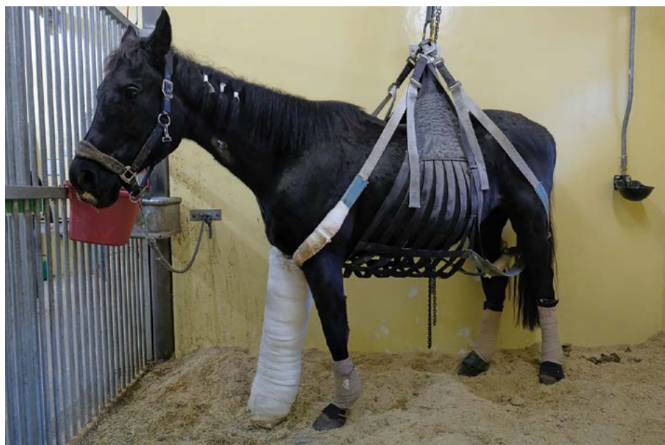
Zpráva vyhodnocuje také rozsah a úroveň veterinární odborné činnosti

V oblasti celkového nastavení systému zajišťování a vnitřního hodnocení kvality činností jsou požadavky a jejich posuzování směřovány v části zajišťování kvality na úroveň nastavení systému vnitřními předpisy, stanovení dílčích požadavků zajišťování kvality, nastavení sledování (monitoring) naplňování požadavků a přijímání průběžných opatření. V části vnitřního hodnocení kvality jsou požadavky a jejich posuzování směřovány na stanovení dílčích požadavků hodnocení kvality, získávání podkladů pro vlastní hodnocení, roční vyhodnocení plnění požadavků a souhrnné návrhy