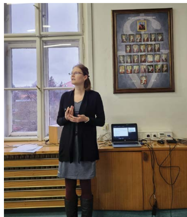
Obhajoba projektu CRP 2022 zaměřeného na rozvoj vysokoškolských knihoven