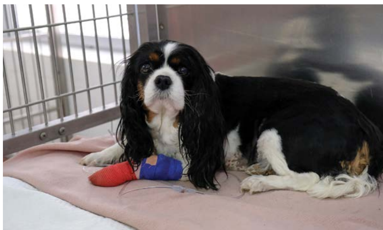
Řešení projektů IVA využívá zázemí klinik univerzity