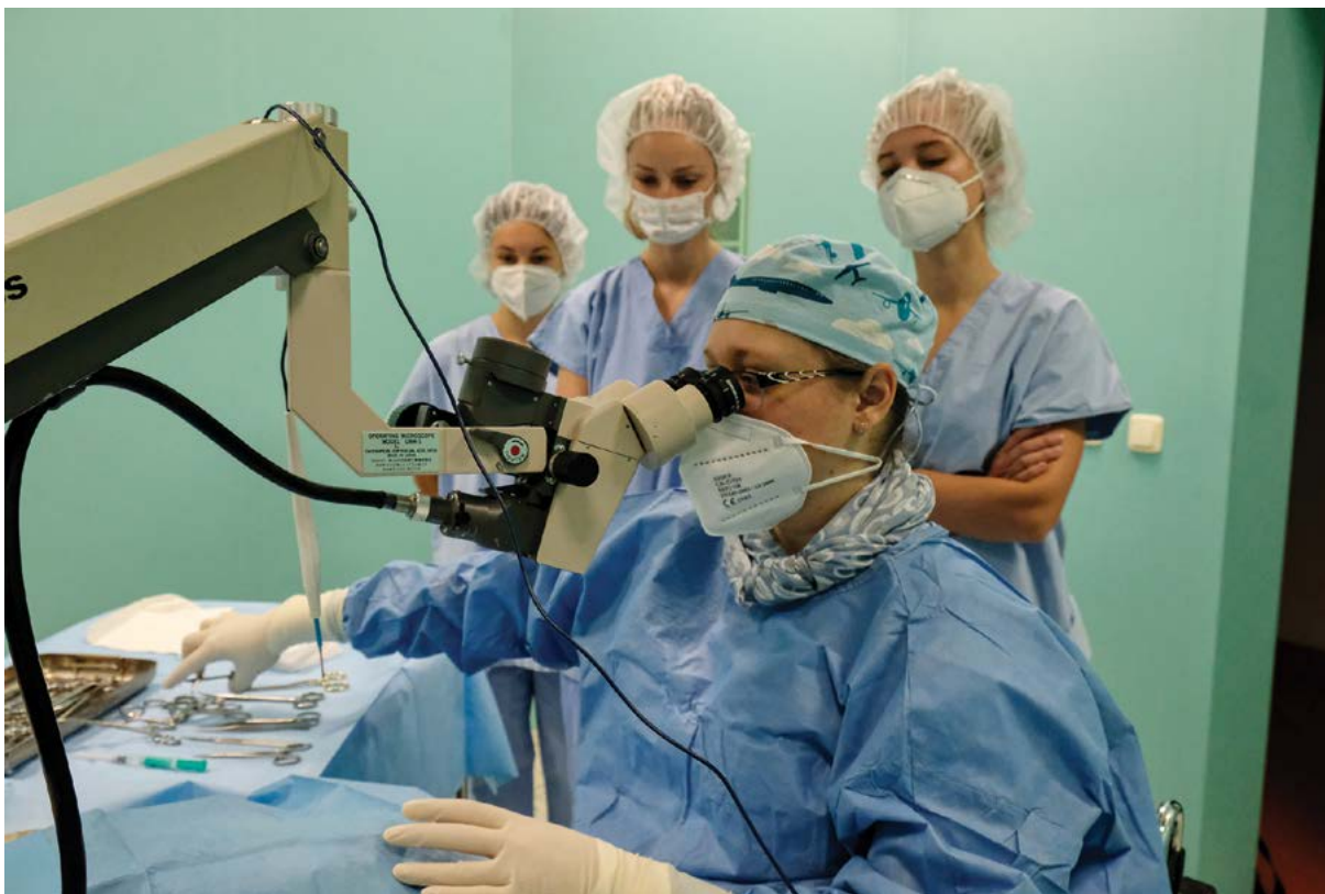
Kvalita činností se na univerzitě v uplynulém období zvýšila

cí plnění požadavků kvality v oblasti habilitačního řízení a řízení ke jmenování profesorem, zejména týkající se naplňování počtu docentů a počtu profesorů ve vztahu k počtu akademických pracovníků.