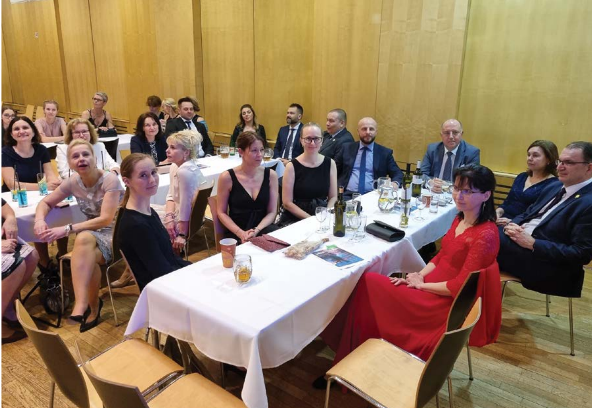
Plesu se účastnili také představitelé univerzity, obou fakult a dalších součástí vysoké školy