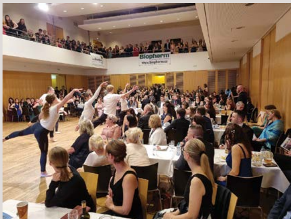
Veterinární ples 2023