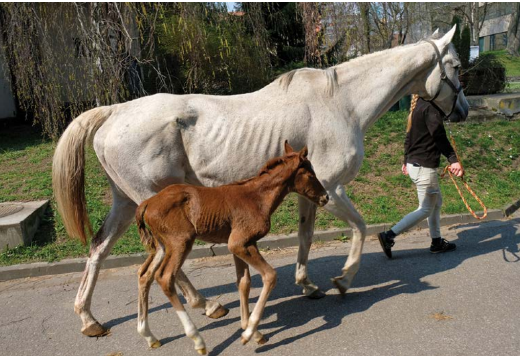
Hodnocení se týká také počtu klinických pacientů na univerzitě

V oblasti hodnocení kvality habilitačních řízení a řízení ke jmenování profesorem jsou uvedeny obory habilitačního řízení a řízení ke jmenování profesorem a doby jejich akreditace, a počty habilitačních řízení a řízení ke jmenování profesorem. Jsou uvedeny poměrové indikátory vyjadřující