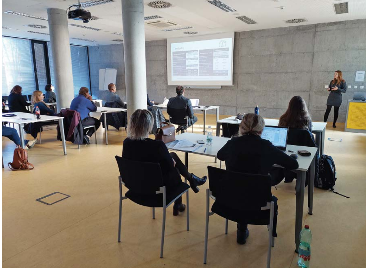
Hodnoceny jsou také výzkumné aktivity na univerzitě

a profesorská řízení jsou upraveny ve vnitřním předpise Řád habilitačního řízení a řízení ke jmenování profesorem univerzity .