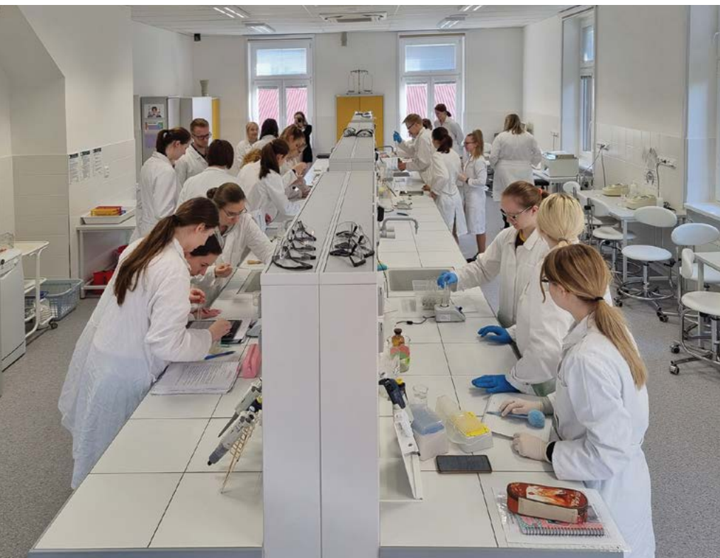
Praktická výuka studentů v laboratořích