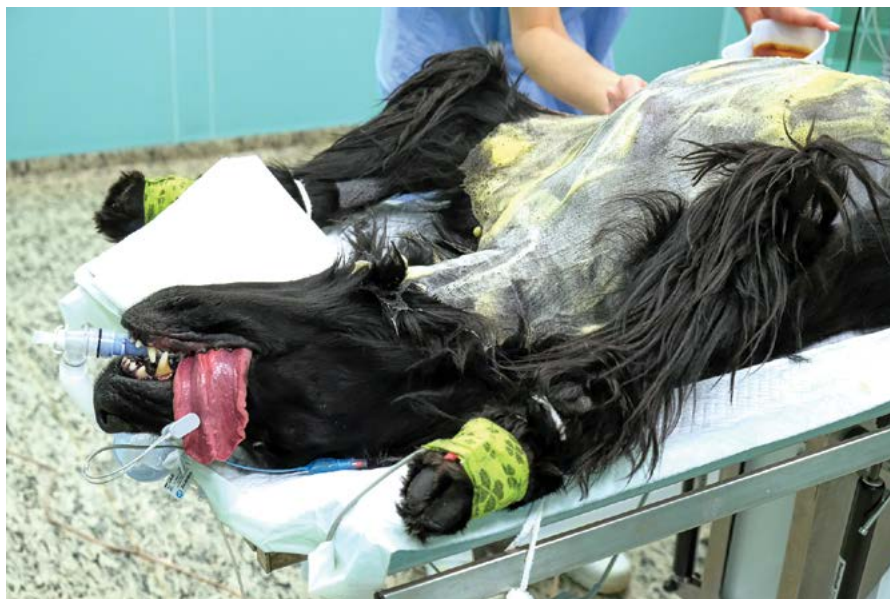
Sledovány jsou také mezinárodní parametry zaměřené na klinické prostředí související s výukou studentů

V oblasti hodnocení kvality tvůrčí činnosti jsou uvedeny počty projektů řešených fakultami a dalšími součástmi univerzity v členění na projekty grantové (externích agentur), institucionálního výzkumu (univerzitní projekty), projekty specifického výzkumu (projekty studentské) a projekty smluvního výzkumu (projekty smluvně řešené pro podniky a instituce). Dále jsou uvedeny počty vědeckých publikací v impaktovaných časopisech v členění podle kvality na zahraniční v kvartilu mezinárodního srovnání Q1 a Q2, v kvartilu Q3 a Q4, a na domácí v kvartilu mezinárodního srovnání Q1 a Q2, v kvartilu Q3 a Q4. Jsou uvedeny poměrové indikátory vyjadřující plnění požadavků kvality v tvůrčí činnosti.