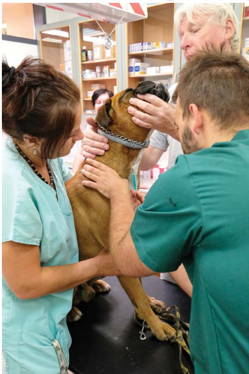
Rozvoj kompetencí přímo relevantních pro život a praxi

Plán realizace strategického záměru Veterinární univerzity Brno obsahuje také souhrn aktivit podporujících strategické řízení univerzity, a to jak na úrovni