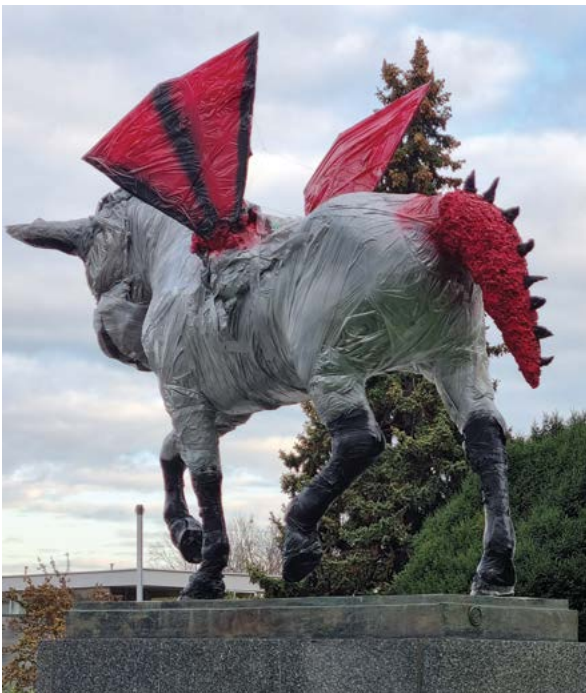
Přeměněný symbol univerzity v rámci veterinárního půlení

P ovídáním o studiu jsme začali, příběhy o profesorech dodali, zážitkům od zkoušek se zasmáli, hloupostem se vysmáli, nejvíc se parodie líbily, mysl naši jasně tříbily.