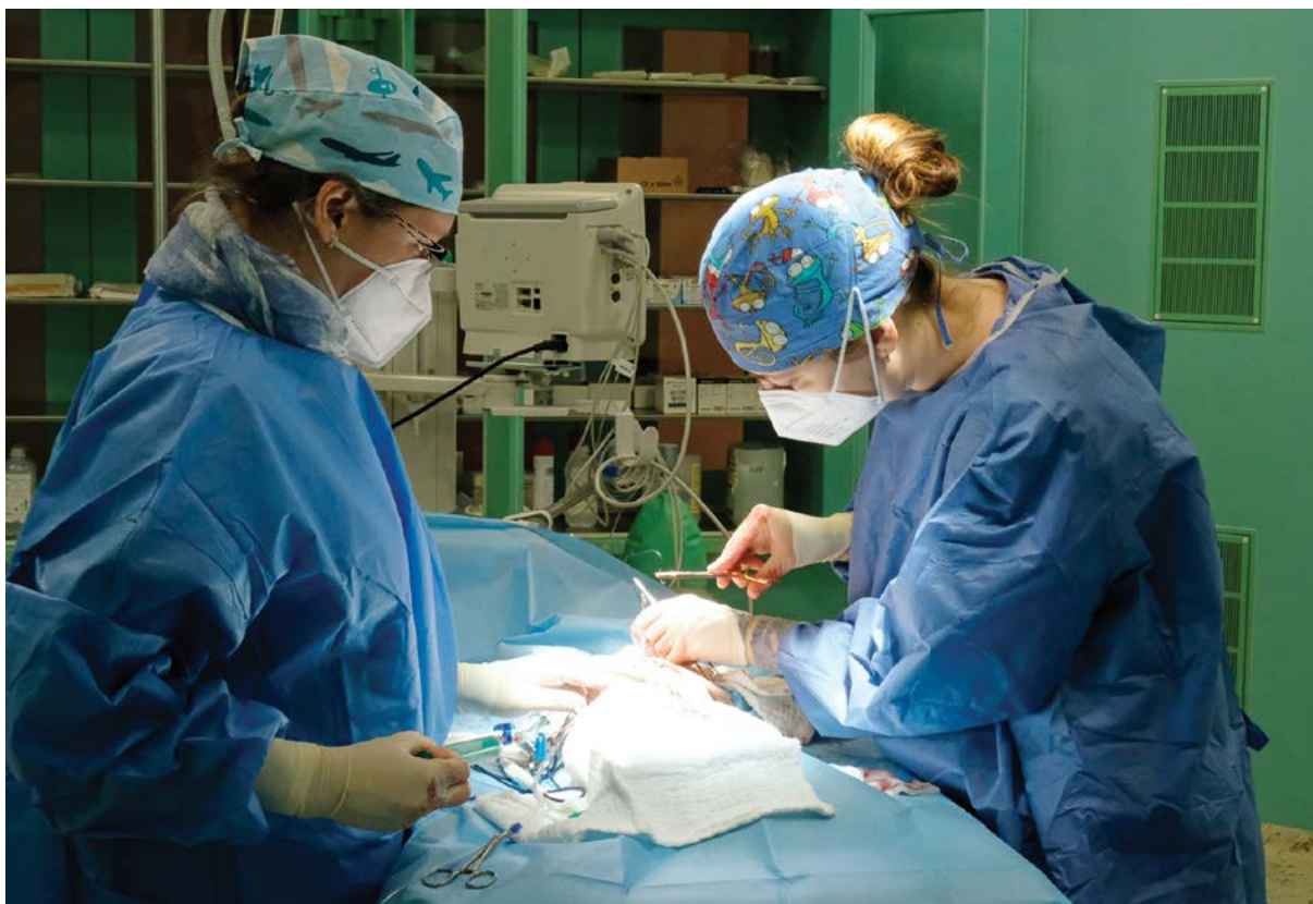
Rozvoj metod klinické výuky je náplní programu PPSŘ