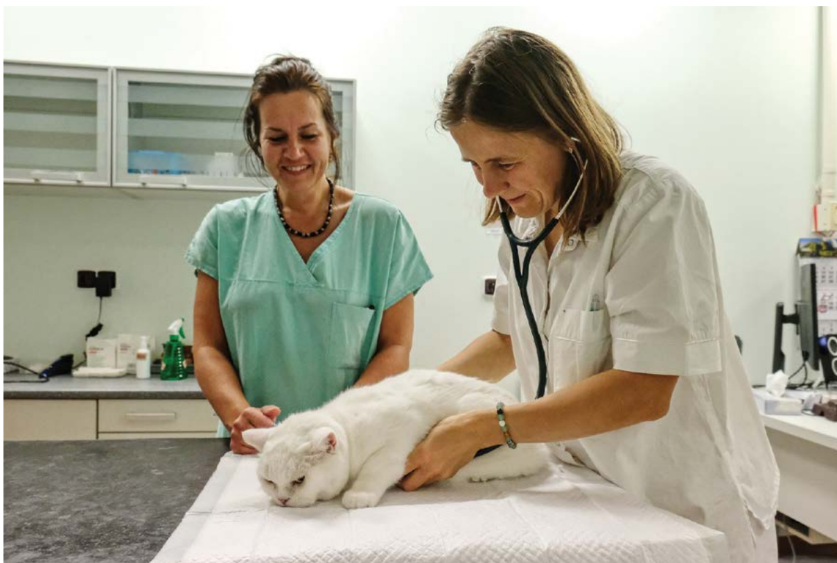
Součástí hodnocení kvality je také studijní program Veterinární lékařství

zajišťování kvality vzdělávací, tvůrčí a s nimi souvisejících činností a vnitřního hodnocení kvality vzdělávací, tvůrčí a s nimi souvisejících činností univerzity, požadavky na činnost z pohledu kvality ve vnitřním předpise Soubor požadavků a ukazatelů výkonu pro činnost univerzity, a souhrnně pak ve formě požadavků na kvalitu činností obsažených jako indikátory ke každé oblasti ve Zprávě o vnitřním hodnocení kvality univerzity, naplňování