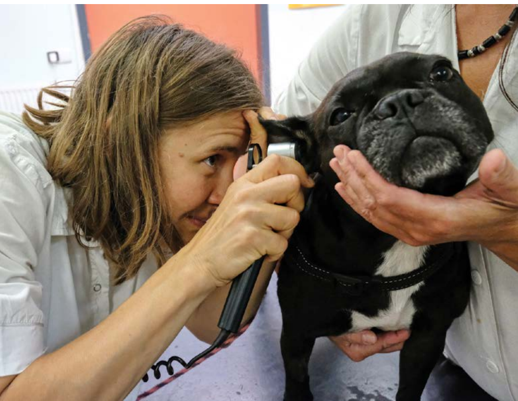
IVA projekty jsou zaměřeny také na rozvoj vzdělávání v rámci klinických předmětů