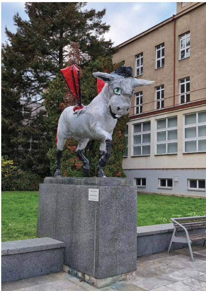
Půlení v roce 2022. Kůň Ardo – symbol univerzity, se v rámci veterinárního půlení převtělil do Dronkee

nejdříve koně Arda ozdobit, pak to řádně oslavit.