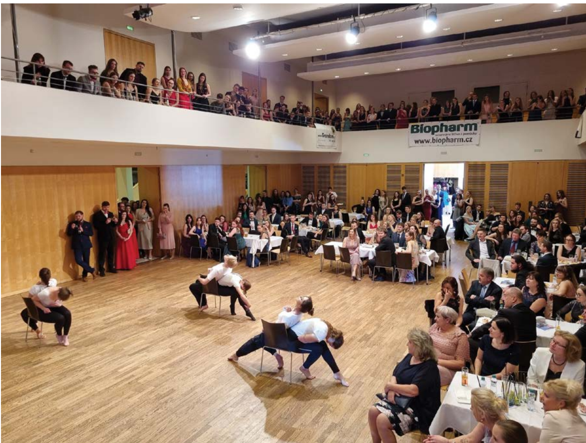
Předtančení na veterinárním univerzitním plesu