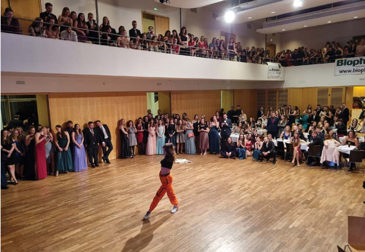
Taneční vystoupení v průběhu veterinárního plesu