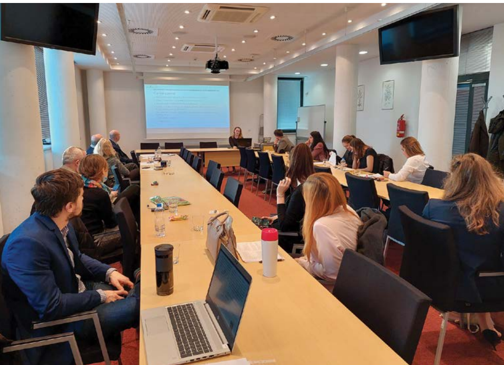
Obhajoba IGA projektů FVL

Interní grantová agentura univerzity poskytuje účelovou podporu na projekty výzkumu prováděné studenty při uskutečňování akreditovaných dok-