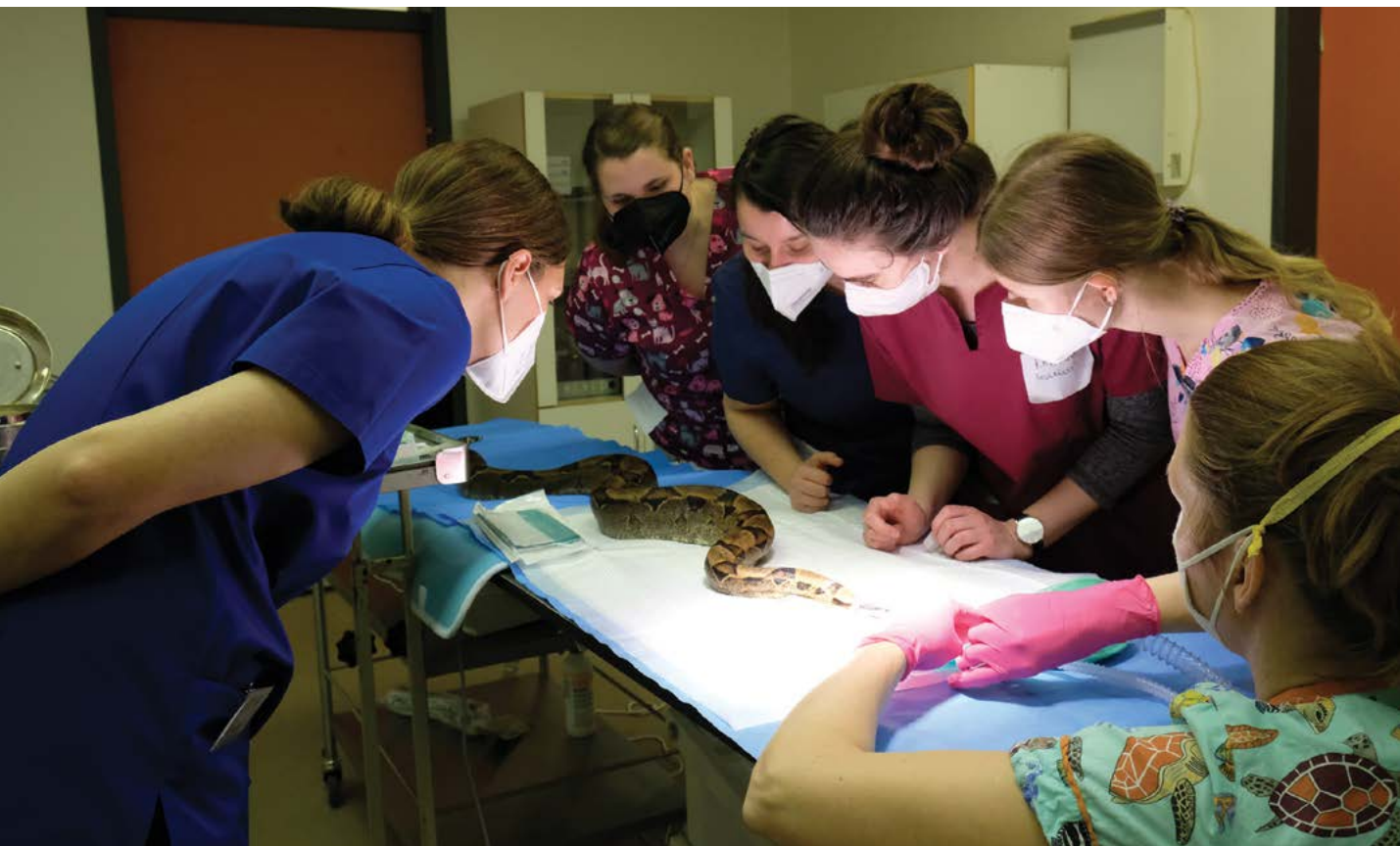
V rámci CRP jsou řešeny na úrovni vysokého školství standardy kvality výuky, veterinární vzdělávání zde má specifické postavení