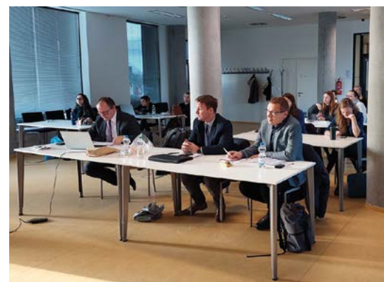
Hodnocení IGA projektů komisí

Pro rok 2023 byly vyhlášeny prioritou pro soutěž o účelovou podporu na specifický vysokoškolský výzkum na univerzitě aktuální problémy ve veterinárním lékařství, veterinární hygieně a ekologii, bezpečnosti a kvalitě potravin, ochraně zvířat a v gastronomii. Výsledky hodnocení podaných projektů jsou uvedeny v tabulce č. 2.