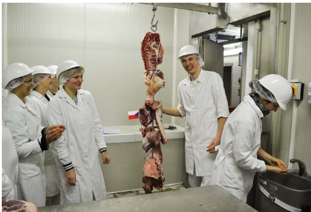
Hodnoceny jsou studijní programy na Fakultě veterinární hygieny a ekologie

Z pohledu studijních programů je stanoven postup vnitřní akreditace studijních programů vnitřním předpisem Postup posuzování studijních programů v rámci jejich vnitřní akreditace na univerzitě a dále postup hodnocení studijních programů vnitřním předpisem Hodnocení studijních programů, jejich sestavování, požadavky na ně a jejich kontrola . Vlastní podmínky studia a pro ověřování znalostí v průběhu studia stanoví pro pregraduální studium vnitřní předpis Studijní a zkušební řád v bakalářských a magisterských studijních programech univerzity , pro postgraduální studium vnitřní předpis Studijní a zkušební řád v doktorských studijních programech univerzity a pro celoživotní vzdělávání vnitřní předpis Řád celoživotního