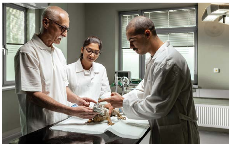
Univerzita získává prostředky z výuky v angličtině pro zahraniční studenty