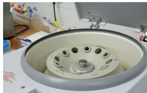
Výzkumná činnost řady projektů se opírá o kvalitní laboratorní zázemí