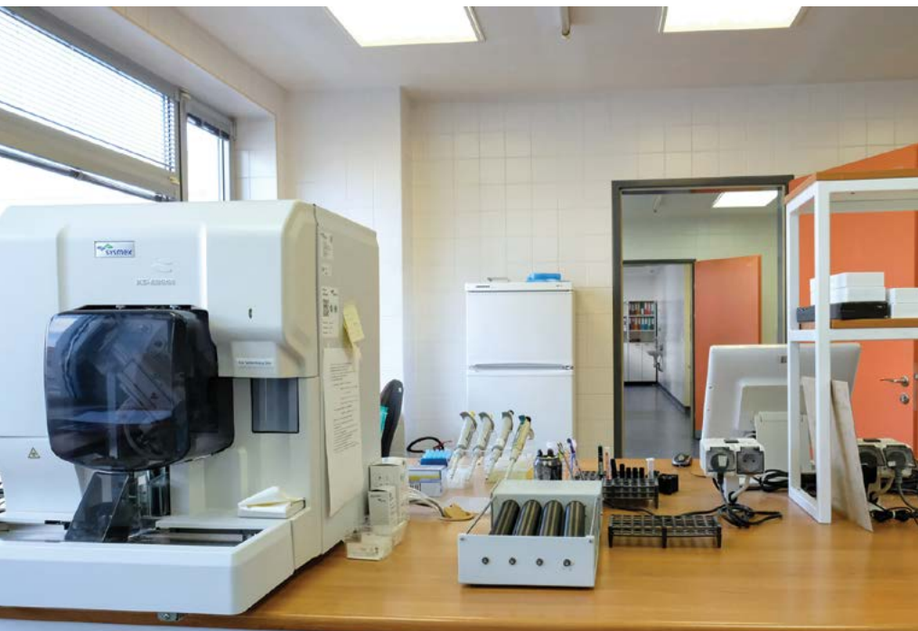
Zpráva o kvalitě hodnotí také úroveň výzkumu a publikační činnosti

V rámci systému kvality je vyhodnocována také tvůrčí činnost na fakultách a univerzitě. Posuzování se soustředí zejména na získávání externích grantů fakultami a univerzitou a na rozsah a kvalitu publikační činnosti ve vědeckých a odborných časopisech a na mezinárodních a národních konferencích. Podmínky posuzování tvůrčí činnosti jsou upraveny vnitřním předpisem Hodnocení tvůrčí činnosti na univerzitě .