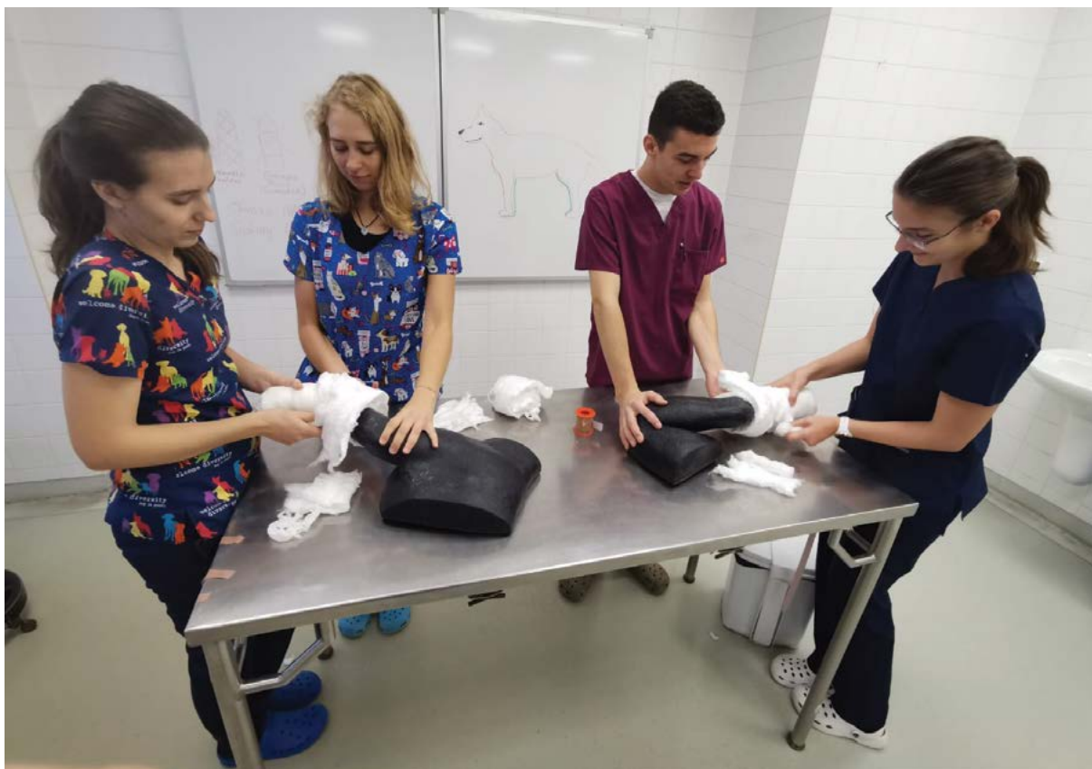
Rozvoj vzdělávání – výuka v simulačních centrech na univerzitě